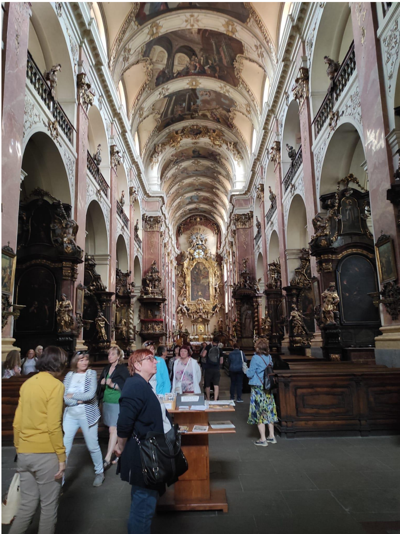
Bazilika sv. Jakuba