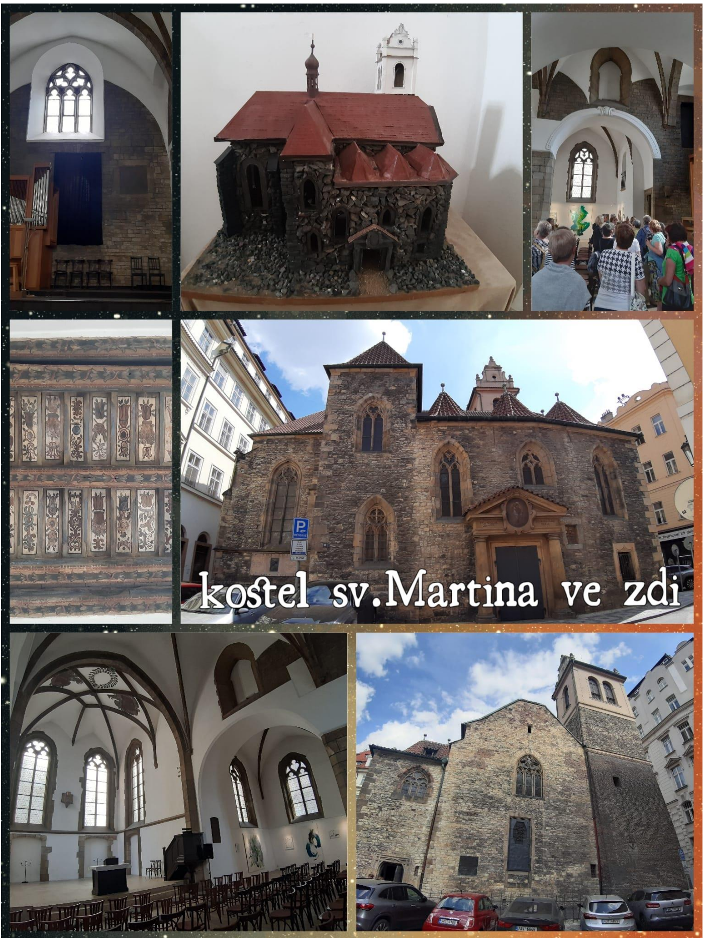
kostel sv. Martina ve zdi